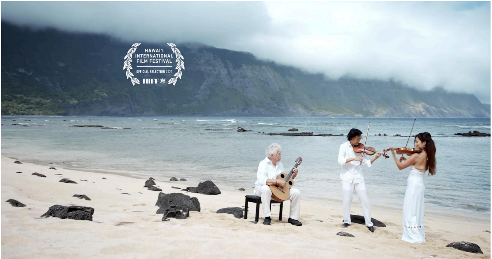
<하와이 연가> '칼라우파파의 눈물' 중 한 장면